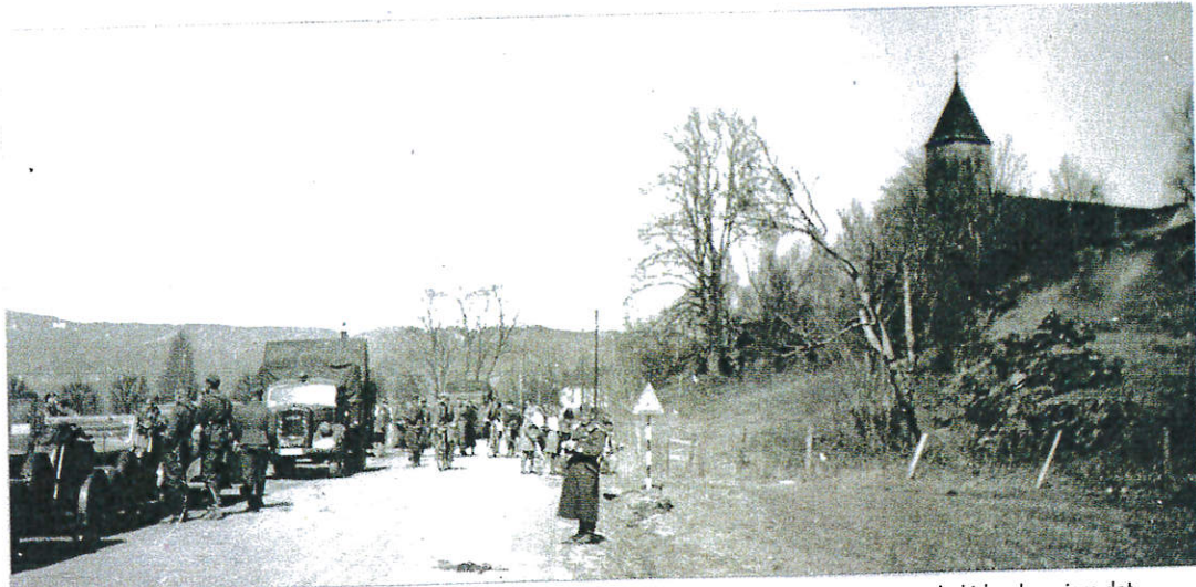
OSLO - KRISTIANSAND: En tysk kolonne har tatt pause et sted på strekningen mellom Oslo og Kristiansand - kirken bør gjøre det mulig å kjenne seg igjen. Den første lastebilen er en Opel Blitz. Nysgjerrige nordmenn til fots og på sykkel benytter anledningen til å studere «gjestene» i uniform, slik de ofte gjorde i krigens første fase.